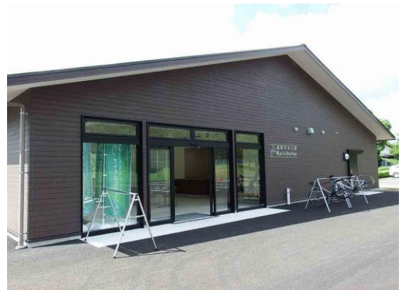
▲ サイクルステーション(メイン)